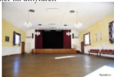
Stor sal med scen och ljudanläggning