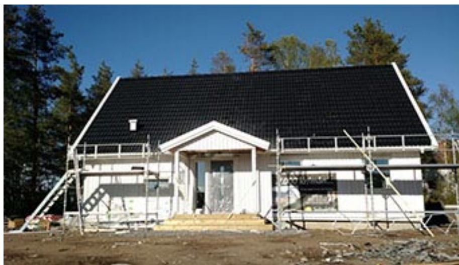
Nybygge på Ensgränd