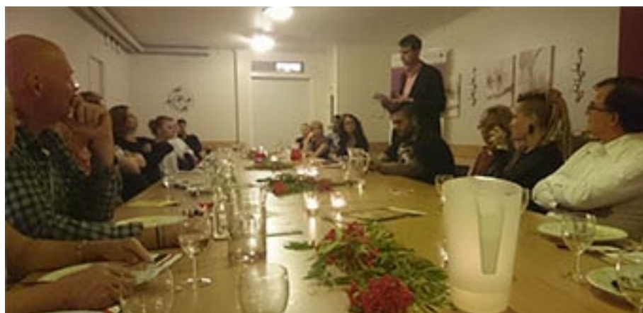
Information av Sparbanken Nords