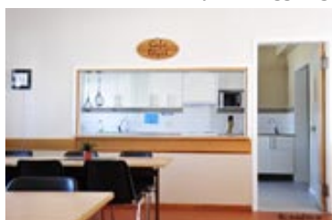
Fullt utrustat kök/ Café