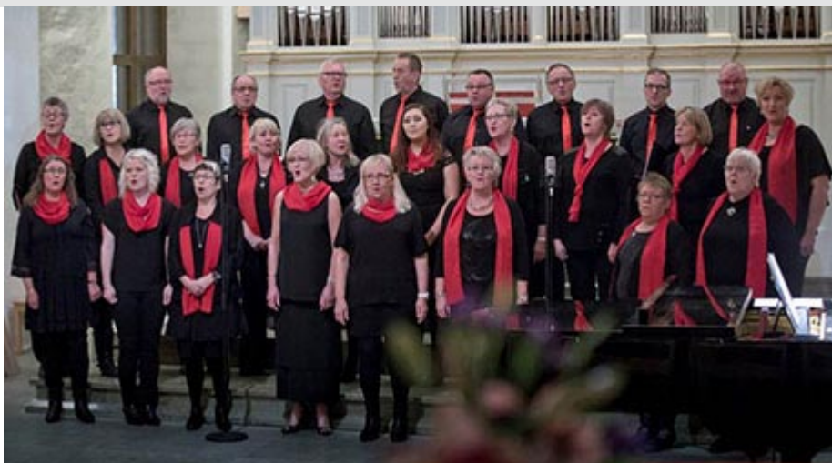
Luciakröning 2014 i Öjeby kyrka

Snart lysas vintermörkret upp av glimmande stakar och gnistrande stjärnor i många fönster. Adventstiden är nära och med den, all den fantastiska musik som hör tiden till.